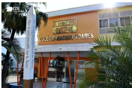
Figura 3 - Colégio Macedo Soares