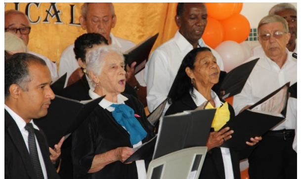
Figura 14 - Coral.