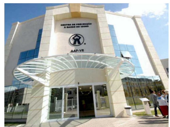
Figura 10 - Entrada principal.