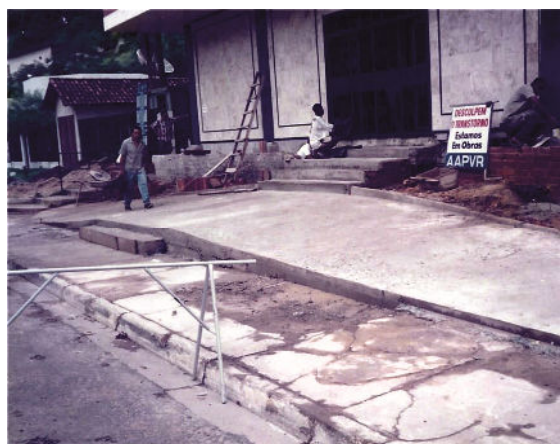
Figura 1- Início das obras de edificação da Sede da Principal.