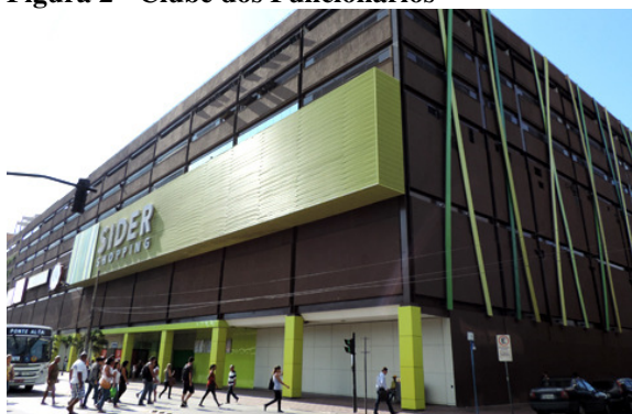
Figura 4 - Shopping Center