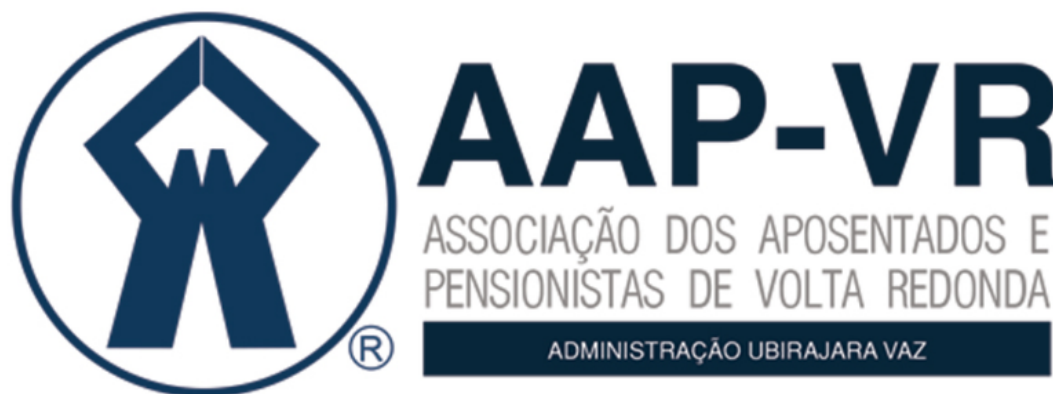
Figura 17 - Logo marca da Associação dos Aposentados.

Fica tombada para fins de preservação de suas finalidades.