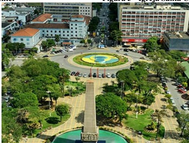
Figura 6 - Praça Brasil.