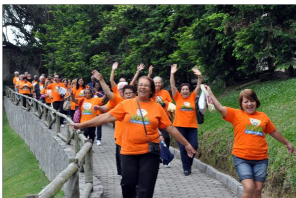
Figura 15 - Excursão da Terceira Idade.