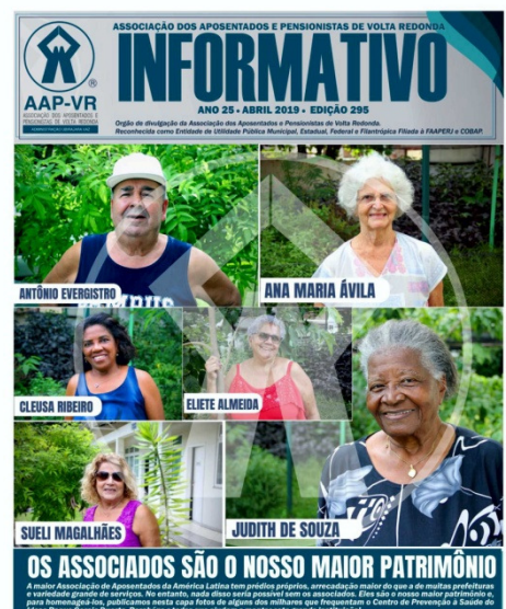
Figura 16 - Jornal Informativo da Associação.