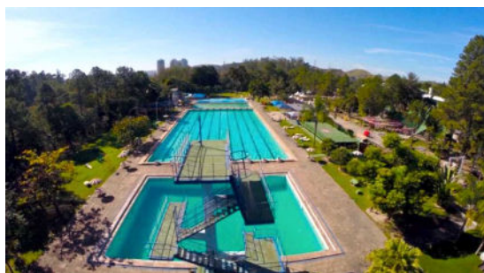
Figura 2 - Clube dos Funcionários

Nas imediações, além de casas e hotéis, também é possível contar com clubes, escolas, Shopping Center, igreja, praças, jardim e alguns serviços de utilidade pública... Segue alguns exemplos ilustrados abaixo.