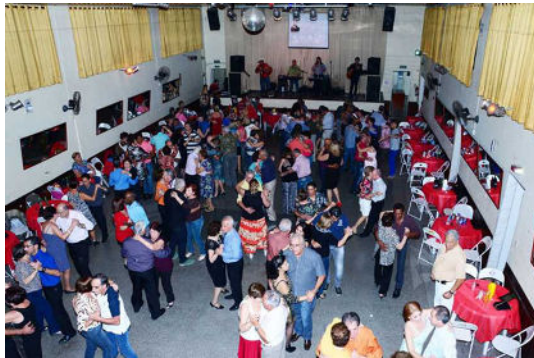
Figura 11 - Jantar Dançante.

Estruturado como um Centro de prevenção, assistência, capacitação, reabilitação e socialização. Coordenado pela Diretoria de Assistência Social, O CPSI tem como Instituição Mantenedora à AAP-VR. Encontram-se, comprometidos com o desenvolvimento de atividades sociais que atendam às necessidades específicas do idoso, associado ou não. Voltado para ações que garantem várias atividades (todas voltadas ao condicionamento físico e mental) o idoso pode usufruir de ampla sala para fisioterapia, com vários boxes individuais (modernos equipamentos) alongamento, relaxamento, ginástica, yoga, pilates, tai chi chuan, excursões em outras cidades, entre outros.