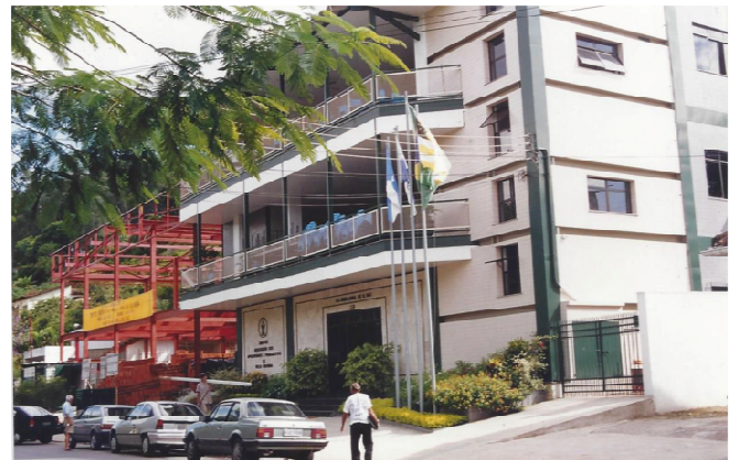
Figura 19 - Nos dias de hoje.