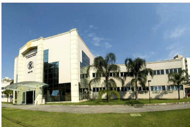
Figura 9 - Fachada do Centro de Prevenção.

A maior unidade e mais utilizada pela maioria dos 40 mil associados, é o Centro de Prevenção à Saúde do Idoso Roque Garcia Duarte (CPSI) , em maio de 1998, diante das necessidades sociais dos aposentados e pensionistas de Volta Redonda.