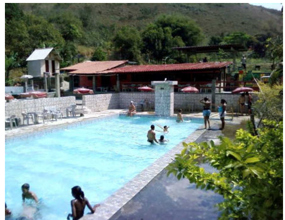
Figura 8 - Sede Campestre em Vargem Alegre.

A maior unidade e mais utilizada pela maioria dos 40 mil associados, é o Centro de Prevenção à Saúde do Idoso Roque Garcia Duarte (CPSI) , em maio de 1998, diante das necessidades sociais dos aposentados e pensionistas de Volta Redonda.