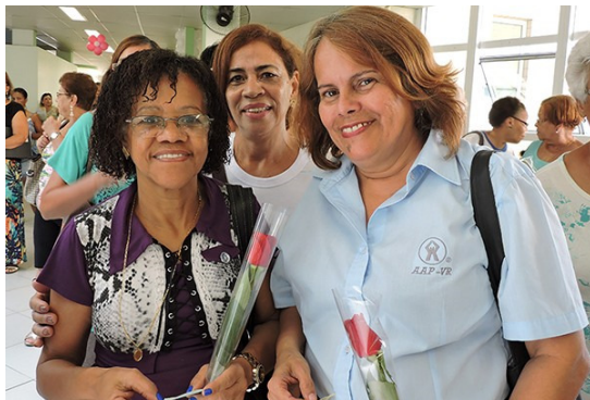
Figura 13 - Comemoração do Dia da Mulher.