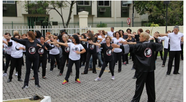
Figura 12 - Tai chi chuan.