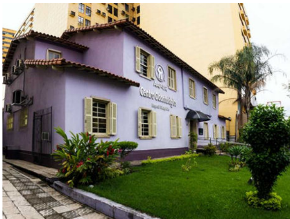
Figura 7- Centro Odontológico

Inicialmente ocupava sedes provisórias e hoje possui um sólido patrimônio, com imóveis próprios, modernas e acessíveis, que oferecem conforto e segurança aos seus funcionários e associados.