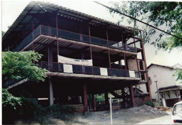
Figura 18 - Sede Administrativa em obras.